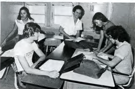
Studenten houden overleg in een daarvoor bestemde ruimte.

Het B.C. stelt vaak, dat zij hun zaken zelf zullen regelen, maar in de praktijk blijkt daar helemaal niets van terecht te komen. De mensen van onderwijszaken zijn te veel bezig met te controleren of de leerkrachten